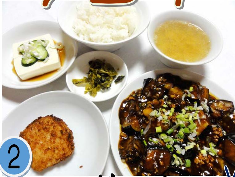
2 マーボナス ¥800