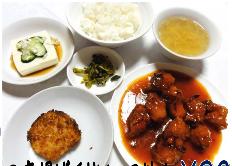
3 鶏肉の唐揚げチリソース炒め ¥900