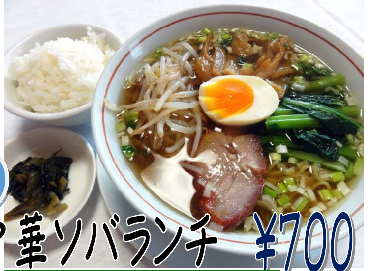
1 中華ソバランチ ¥700