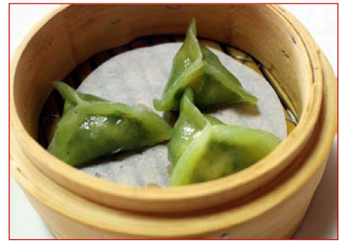
ヒスイ蒸しギョーザ