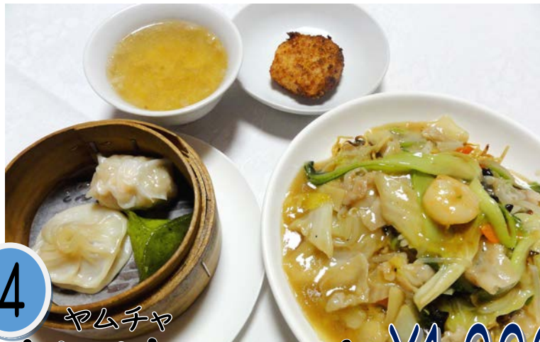
4 飲茶セット ¥1,000