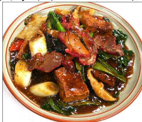
チャーシューと揚げ豆腐のうま煮 ¥ 1220