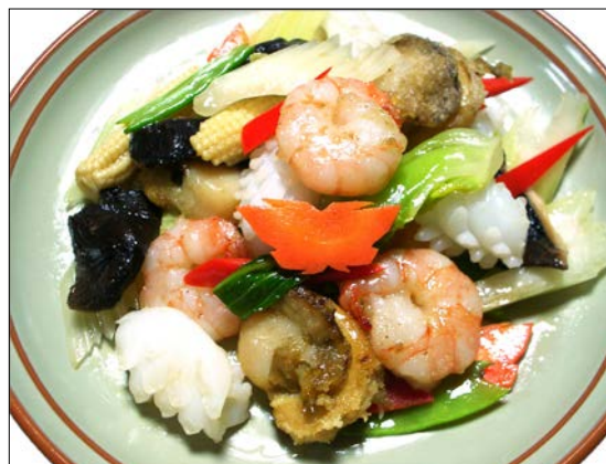
海鮮と季節野菜の炒め ¥1,730