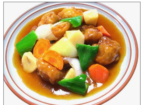
白身魚の甘酢がけ ¥1,020