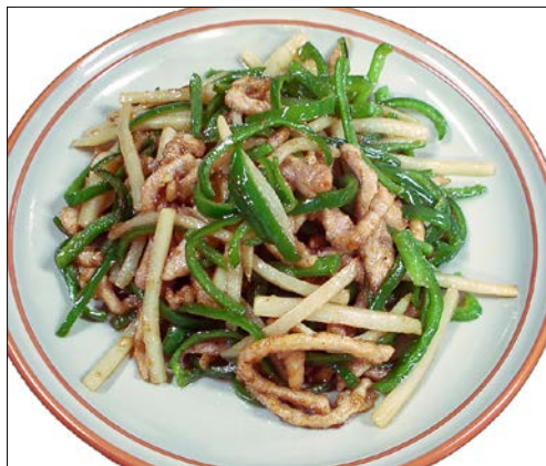
チンジャオロースー ¥ 1220