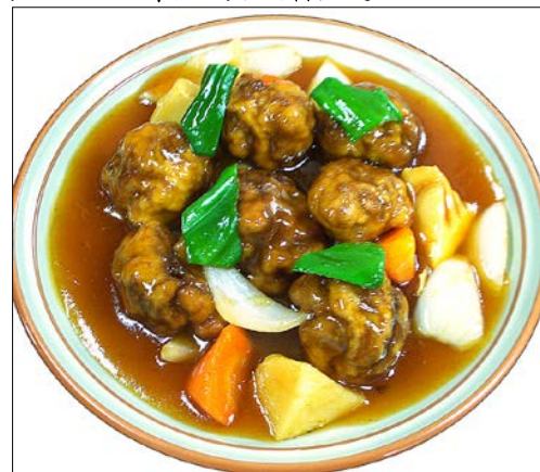
すぶた ¥ 1220