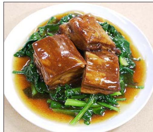
豚肉の柔らか煮込み ¥ 1320