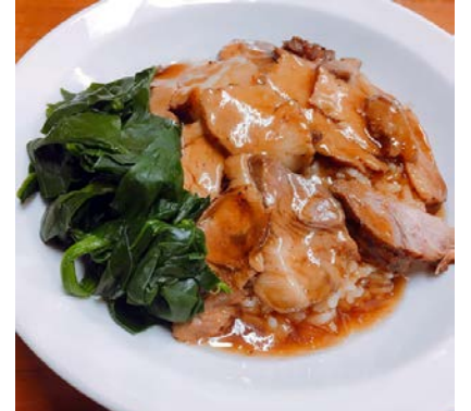
煮込みチャーシュー丼 ¥820