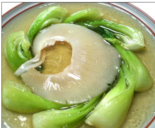
フカヒレの姿煮こみ(1枚) ¥6,100