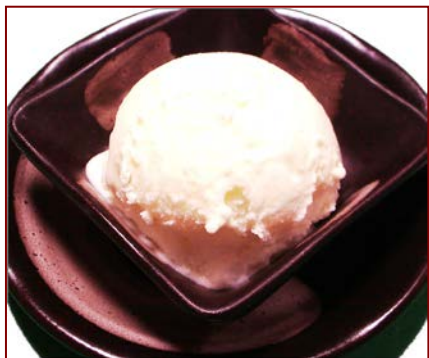
ココナッツアイス