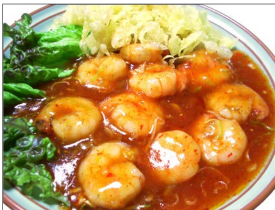
エビのチリソース ¥1,730