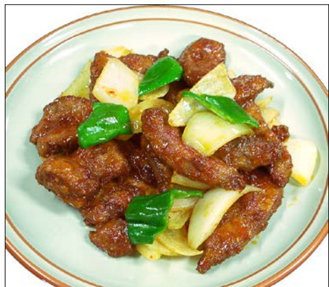
豚レバーの辛子炒め ¥ 920