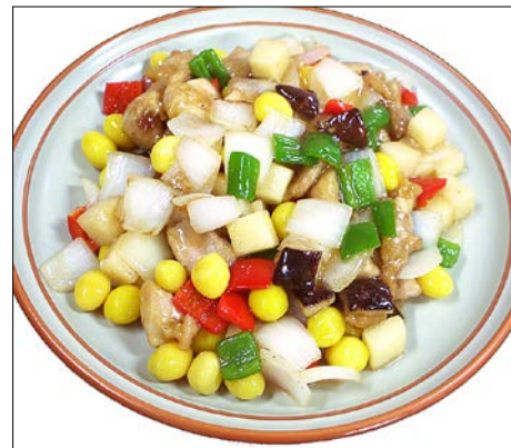
鶏肉とギンサンの炒め ¥ 1220