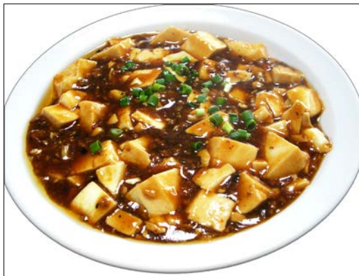
マーボー豆腐 ¥ 710