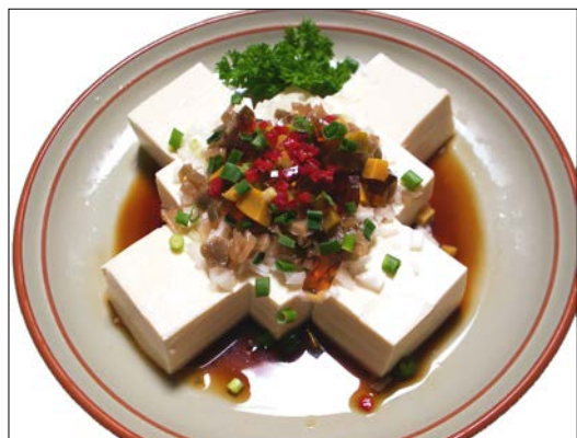
中華風冷やっこ ¥ 710