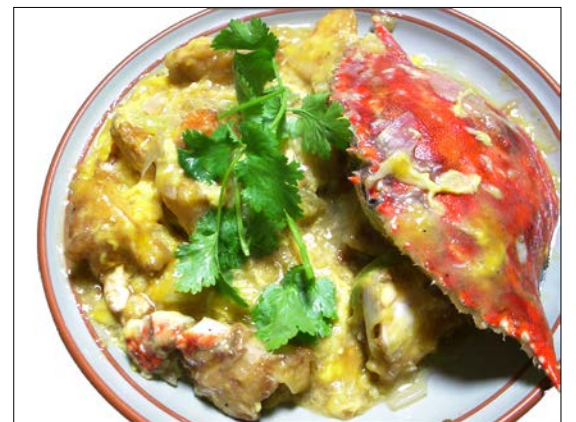
渡り蟹の玉子煮込み ¥1,850