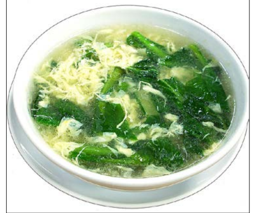
野菜入り玉子スープ ¥510