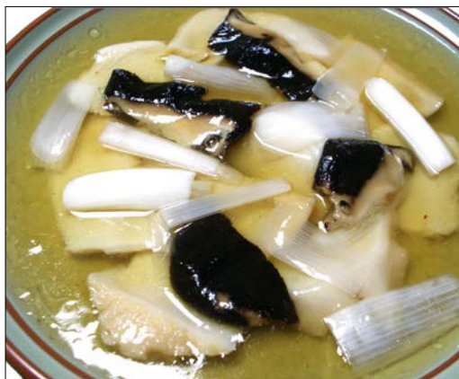
チリアワビのカキ油炒め ¥5,000