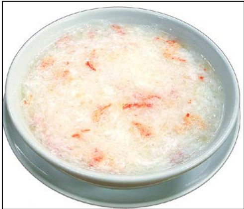
カニ肉入りふかひれスープ ¥2000