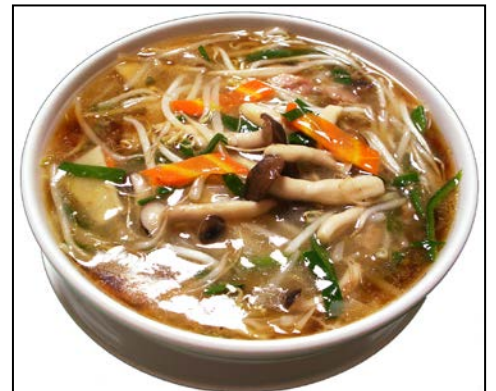
きのこ野菜のうま煮そば ¥920