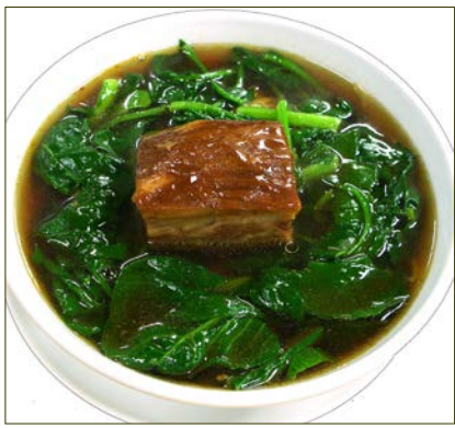
豚肉の柔らか煮込みそば ¥920