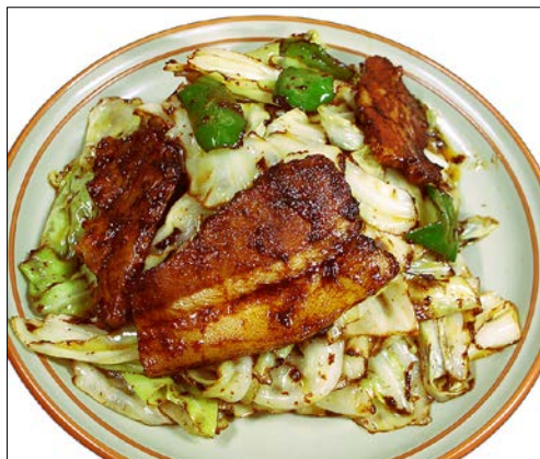
ホイコーロー ¥ 920