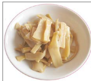
メンマ ¥ 360