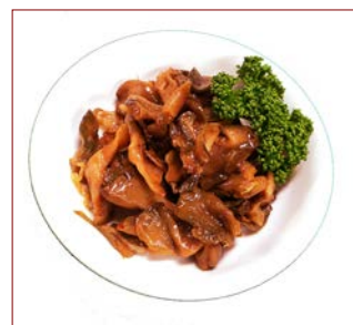
ザーサイ ¥ 360