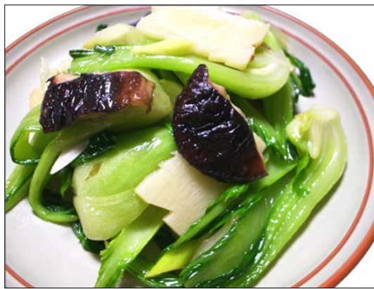
季節野菜の炒め ¥ 820