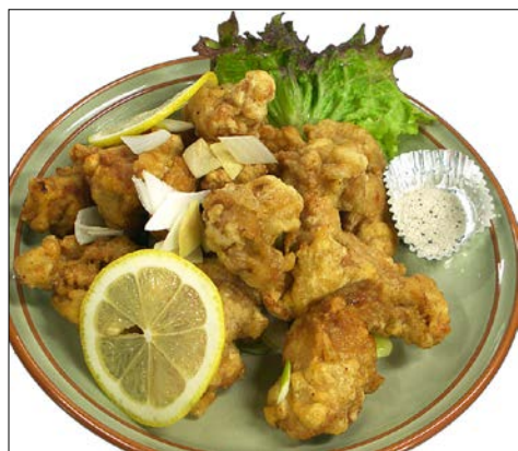
鶏肉の唐揚げ ¥ 1020