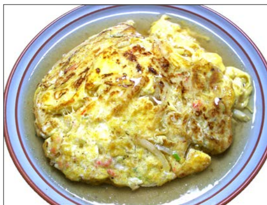
かに玉 ¥ 820