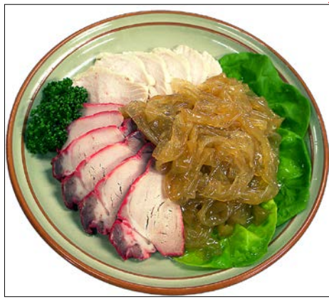
特製三種冷菜盛り合わせ ¥2,850