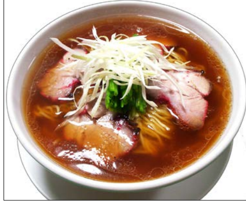
チャーシューそば ¥820