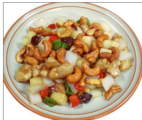
鶏肉とカシュナツツの炒め ¥ 1320