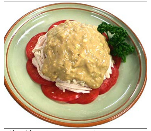
蒸し鶏のゴマソースがけ ¥1,330