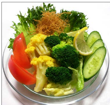
朝採り野菜サラダ ¥ 480