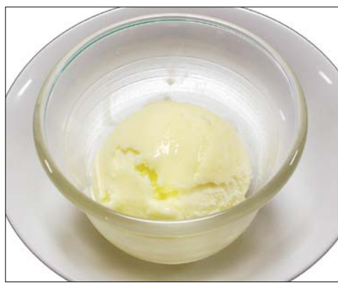
バニラアイスクリーム