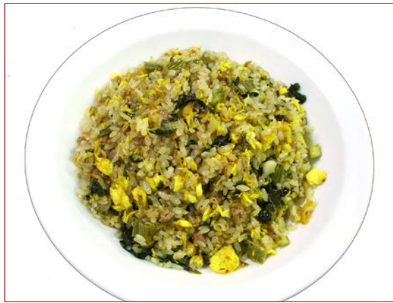
地場の高菜を使った チャーハン ¥ 820