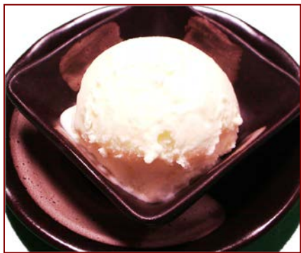
ココナッツアイス