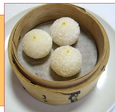
ココナッツのミルク菓子