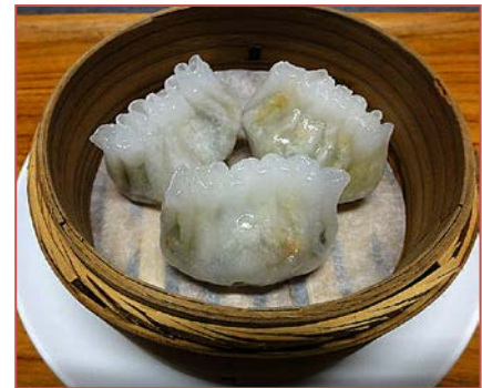
潮州風蒸しギョーザ