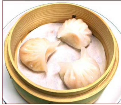
蒸しエビギョーザ