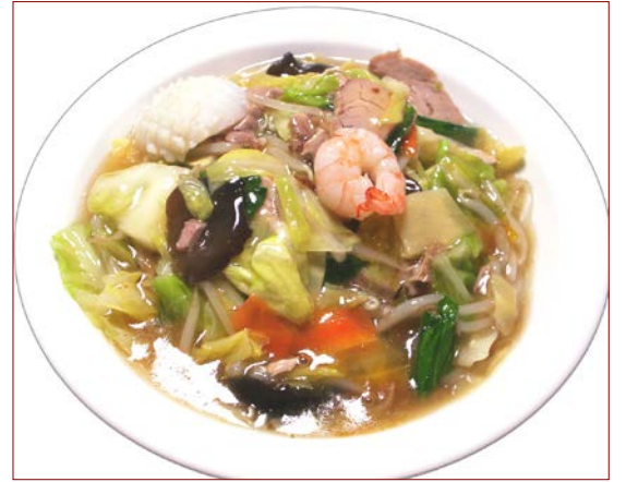
五目かけご飯 ¥ 710