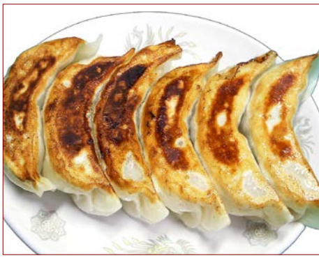
特製焼きギョーザ