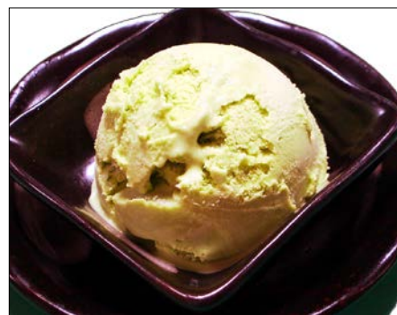
抹茶アイスクリーム