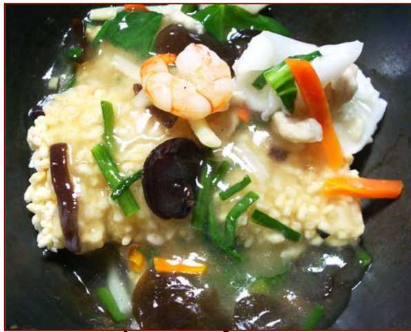
五目おこげ ¥ 920