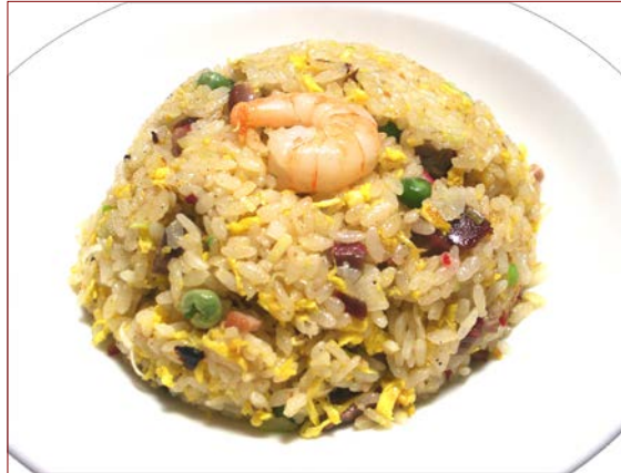
五目炒飯 ¥ 710