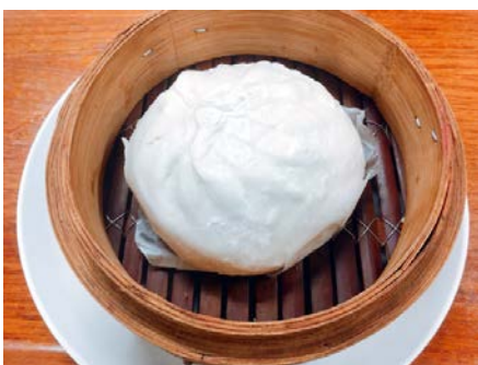
ジャンボ肉まん 1ヶ ¥310