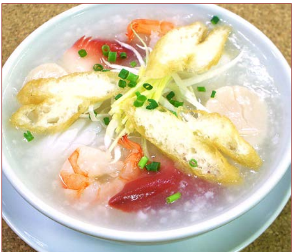
海鮮粥 ¥ 920