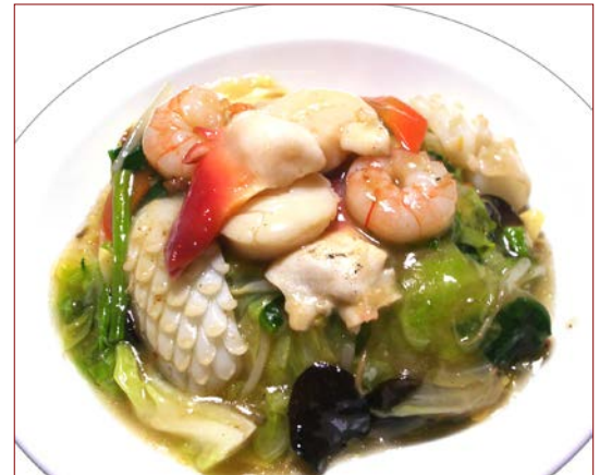
海鮮かけご飯 ¥ 920