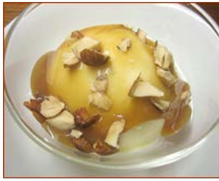
キャラメルアイス