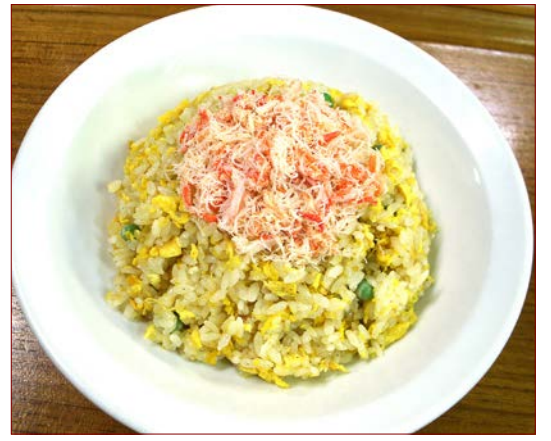
カニ炒飯 ¥ 820