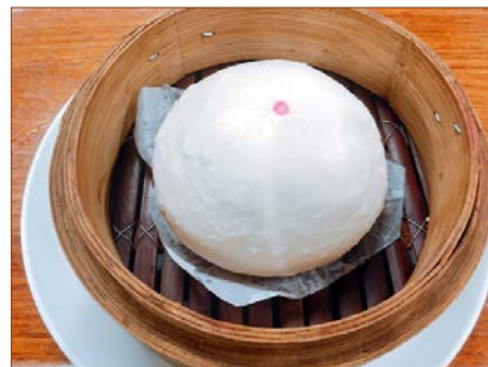
ジャンボあんまん 1ヶ ¥310