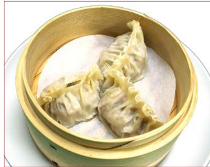
フカヒレギョーザ